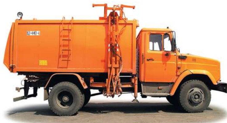
Таблица 1.4.1.3. Технические характеристики мусоровоза 440-4