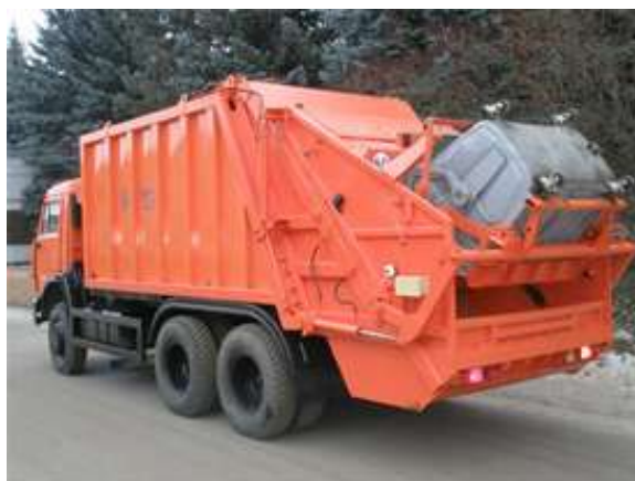
Таблица 1.4.1.2. Технические характеристики мусоровоза КО 440-3