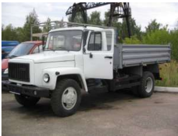
Таблица 2.2.1. Технические характеристики самосвала ГАЗ СА3 35-07

Основные производители бункеровозов – ООО «Торговая компания «КОММАШ» (607220, Нижегородская область, г. Арзамас, ул. 3-я Вокзальная, д.2, тел. (83147) 7-86-13, сайт: http://www.kommash.ru ) и ООО «Экомтех» (123424, Москва, Волоколамское ш., д. 73, оф. 415, тел. (495) 490-68-49, сайт: http://www.ecomtech.ru ).