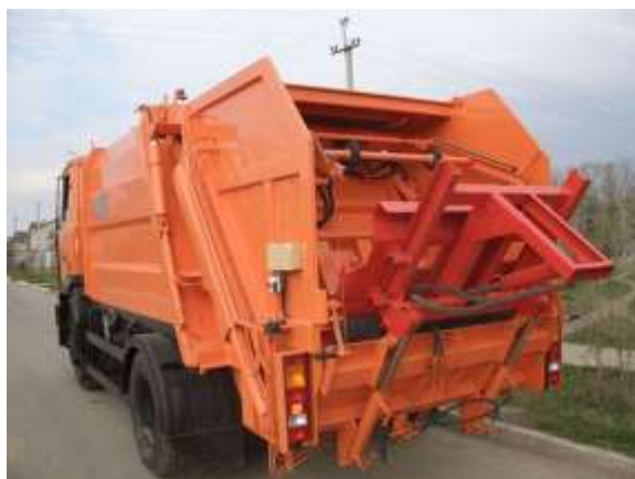
Таблица 1.4.1.5. Технические характеристики мусоровоза КО 457-32