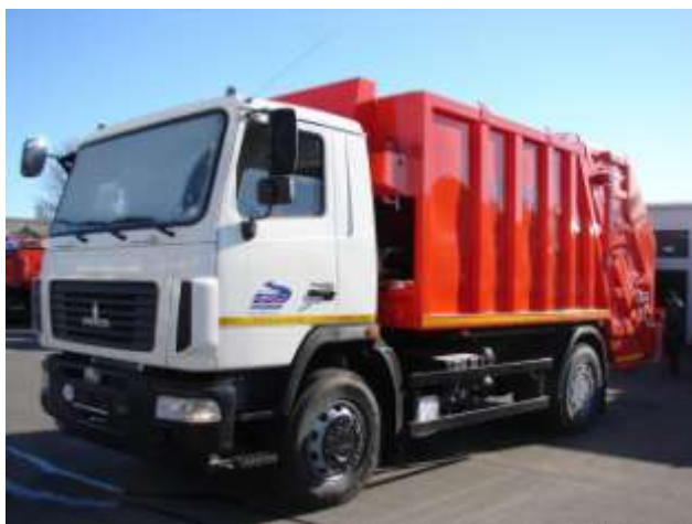
Таблица 1.4.1.1. Технические характеристики мусоровоза КО-427-73