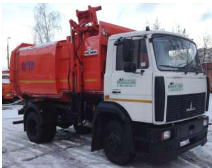
Таблица 1.4.1.6. Технические характеристики мусоровоза КО 449-41