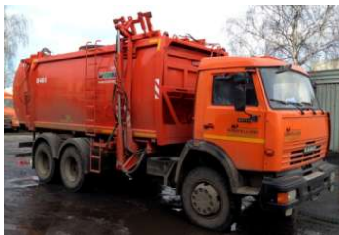
Таблица 1.4.1.4. Технические характеристики мусоровоза КО 440-5