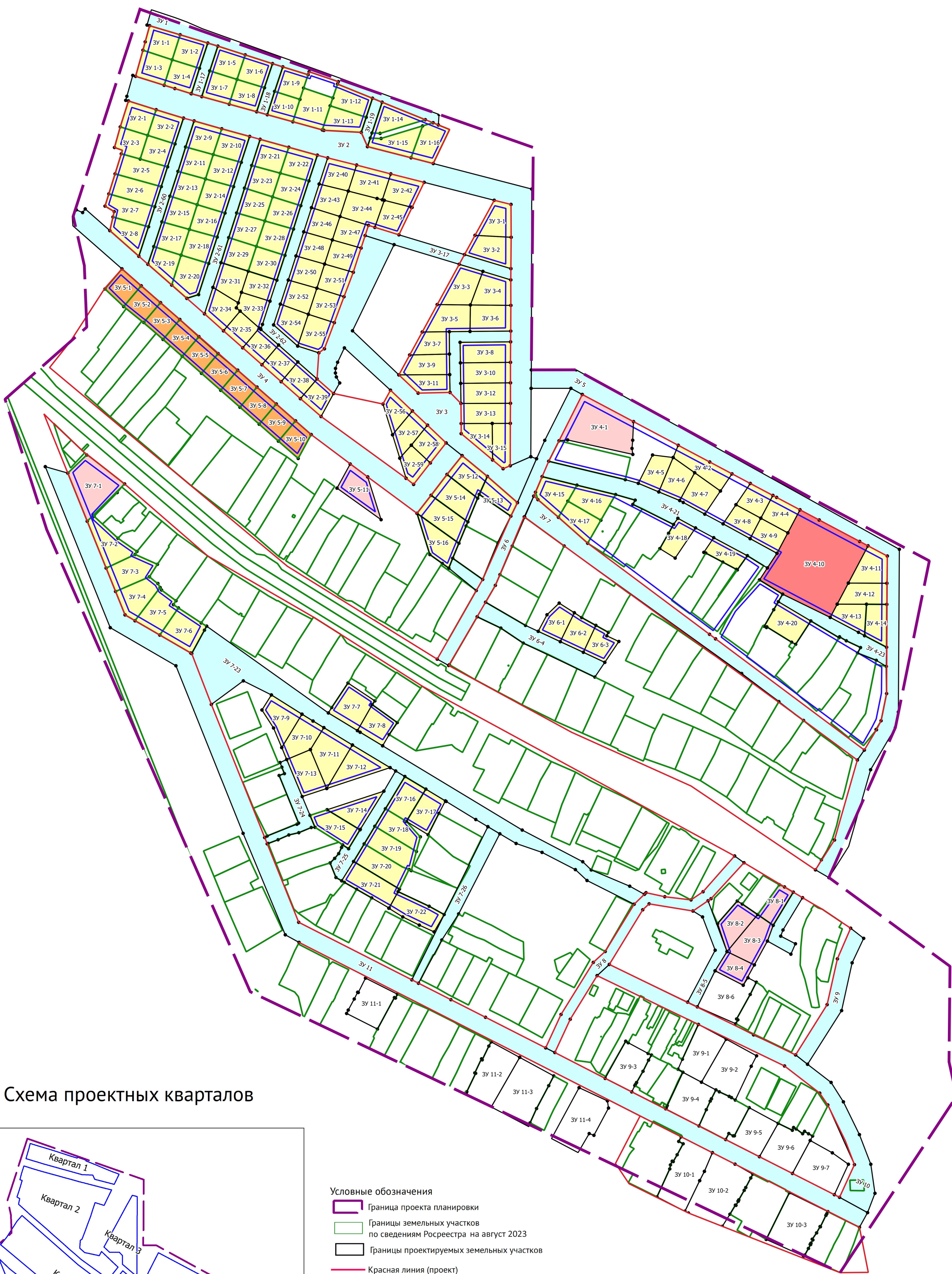
Схема проектных кварталов